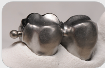
CEKALLOY CB # 6001

Sicheres Ausfließen, Stabilität beim Brandvorgang, leichte Fräsbarkeit und optimale Härte in Verbindung mit Attachments zeichnet diese Legierung aus. Sie lässt sich hervorragend ausarbeiten und ist selbstverständlich nickelfrei – und das zu einem enorm günstigen Preis.